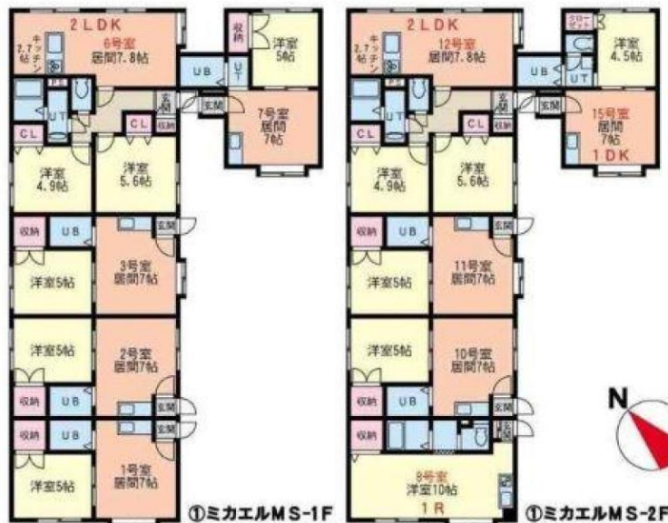
①ミカエルMS-1F ②ミカエルMS-2F ※赤色文字の「6号室、8号室、12号室、15号室」は大規模修繕した部屋です。